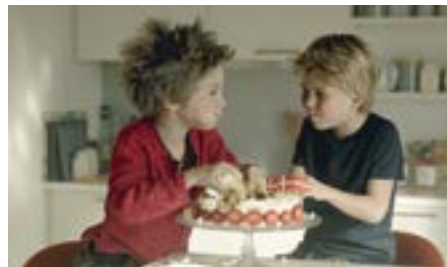
Pixie, der Weihnachtswichtel

Die Kinder des Rezensenten werden älter, das verändert den Blick auf das Kinder- und Jugendfilmprogramm. Nicht der große Wurf, aber doch solide ist Pixie, der Weihnachtswichtel . Dieser verliert in der Weihnachtsnacht den Anschluss und muss bei den Menschen bleiben – wie gut,