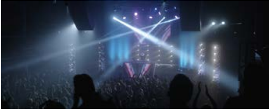
Zwei Nächte bis zum Morgen