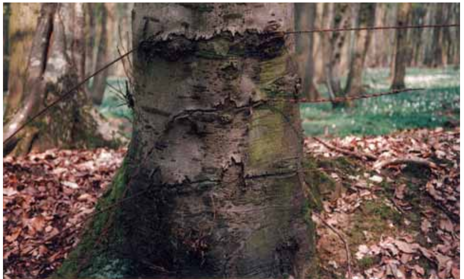
Bezirksgrenze Schwerin-Rostock, Utecht gehörte zum DDR-Bezirk Schwerin, Schattin zum Bezirk Rostock (Mai 2000)

1809 verglich sich das Kloster mit seinen Untertanen, die jetzt Eigentümer ihrer Besitzungen wurden. Die rund 130 ha Wald auf Utechter Flur überließ das Kloster aus unerfindlichen Gründen den dortigen Bauern. In keiner der sonstigen klösterlichen Besitzungen ist ähnliches geschehen. Schattin hatte zu diesem Zeitpunkt nur rund 10 ha Wald, die unzugänglichen Schluchten im heutigen Schattiner Zuschlag. Es war aber eine unbesetzte