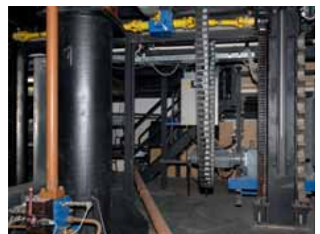
Untermaschinerie Großes Haus : Vorne Hydraulikzylinder, hinten Führungsstützen mit Zahnstange und Ausgleichswelle (gelb)

Doch das meiste Geld, 70.000 Euro, während er Theaterferien spontan zur Verfügung gestellt, sollen soll in dunkle Kanäle fließen. Die Untermaschinerie der Bühne muss nach der Renovierung von 1996 auf den neuesten Stand gebracht werden. Dies sei besonders aus Sicherheitsgründen notwendig. In den letzten Monaten mussten durch Technikausfälle auch schon Aufführungen unterbrochen werden. Glücklicherweise ist noch kein Unfall