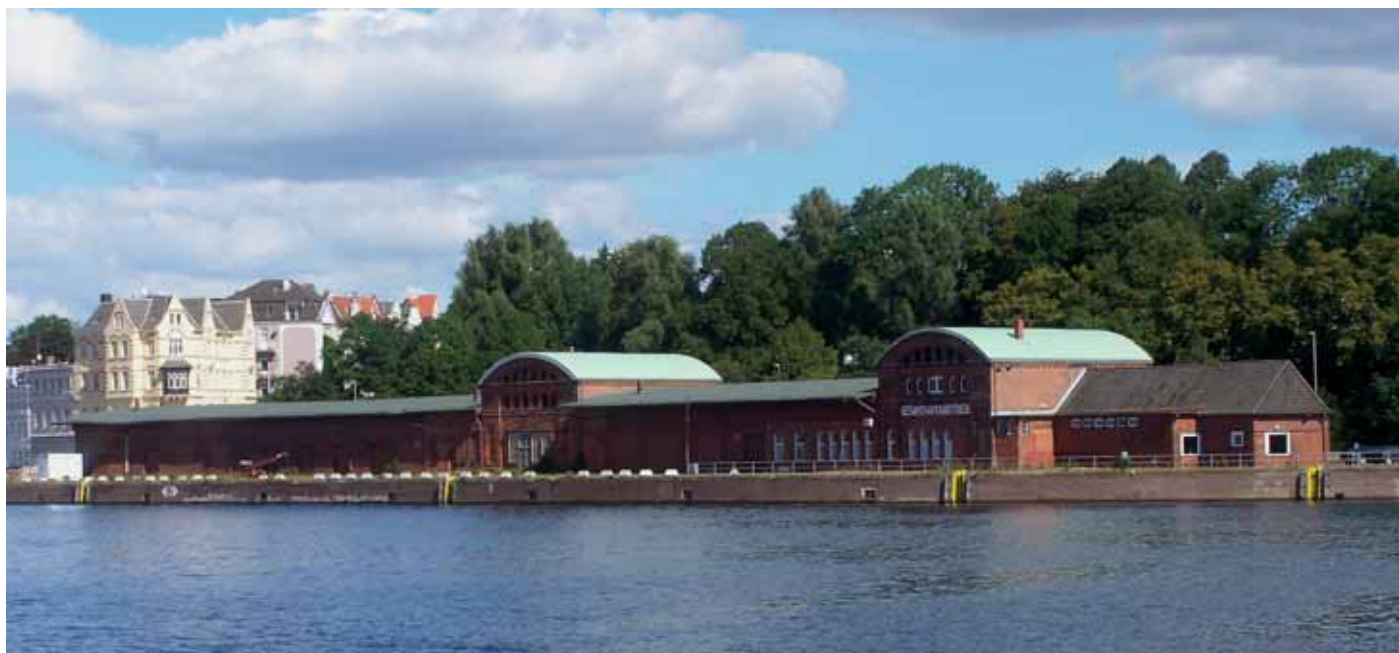
Aufnahme von 2011: Blick aus Südwest