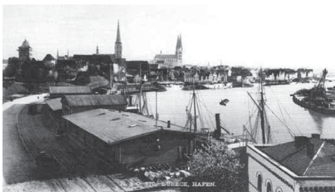
Aufnahme von 1891: Blick aus Nordost