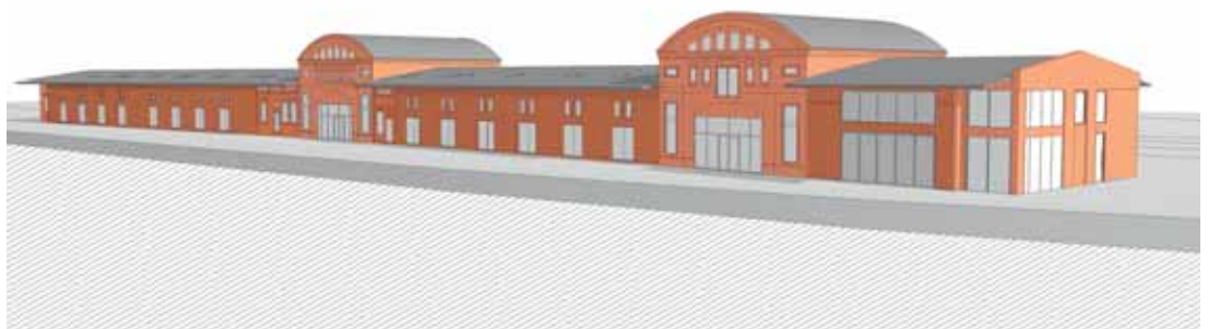
Entwurfsplanung 2011: Perspektive aus Südwest

So wird ab Ende 2012 bzw. Mitte 2013 auf insgesamt ca. 3.300 qm neues Leben in die Schuppen 10/11 einziehen. Mit den erwirtschafteten Mitteln gelingt es ohne öffentliche Zuschüsse, das Objekt komplett instand zu setzen und langfristig zu erhalten. Das Denkmal ist gerettet.