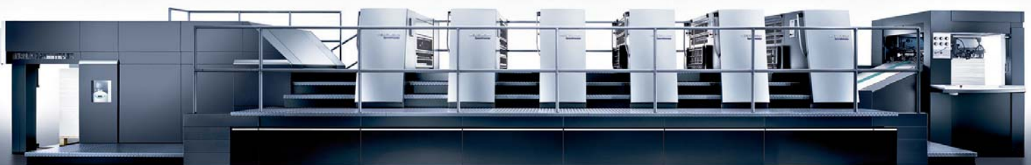
Druckmaschine der Fa. Heidelberg Speedmaster XL-105-5+L · Bogenformat bis 75 cm x 105 cm

Gefördert durch die Europäische Union, Europäischen Fonds für regionale Entwicklung (EFRE), den Bund und das Land Schleswig-Holstein