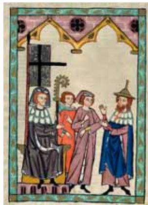
Süßkind, der Jude von Trimberg, Codex Manesse, 14. Jahrhundert

Juden waren im Mittelalter und der Frühen Neuzeit in Lübeck und anderen Hansestädten eine kaum tolerierte soziale Randgruppe. Anhand ausgewählter Fälle wird das jüdische Leben in diesem räumlichen und zeitlichen Rahmen dargestellt und aufgezeigt, wo und wie lange überhaupt jüdische Niederlassungen existierten, welche sozialen, wirtschaftlichen und verfassungsrechtlichen Bedingungen ihnen zugrunde lagen und welche Bedeutung sie besaßen. Die Pestpogrome sowie die Vertreibungen des 15. Jahrhunderts bilden dabei einen thematischen Schwerpunkt.