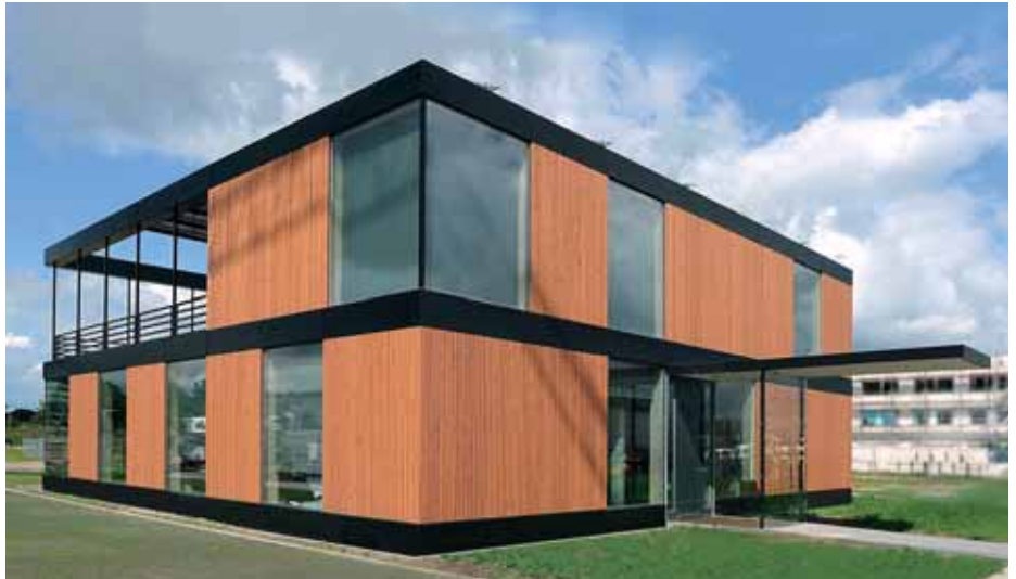
Greenbuilding – AWK-Bürogebäude

Der Bausenator Franz-Peter Boden forderte bei der Eröffnungsveranstaltung ein Umdenken. Er verwies darauf, dass relativ preiswerte Grundstücke ein Umdenken behindern. Die Menschen wer-