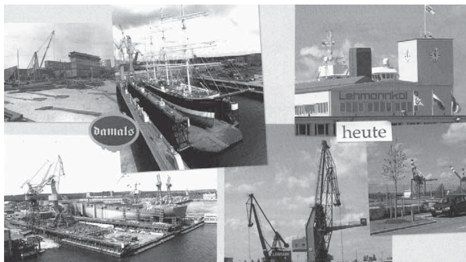
Impressionen aus dem Stadtteil Kücknitz, entnommen der Broschüre „Kücknitz historisch – ein Stadtteil im Wandel der Zeit“, Projekt der Schule Roter Hahn, Klasse 7–9