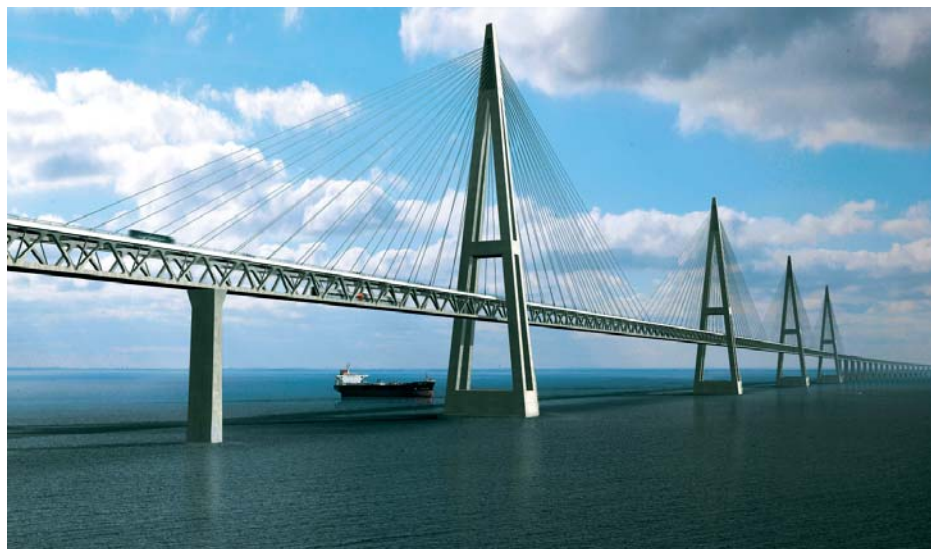
Computergrafik einer Schrägseilbrücke über den Fehmarnbelt

auch das Vorhaben insgesamt: Finanzieller Aufwand und wirtschaftlicher Ertrag würden in keinem Verhältnis stehen, sowohl was den Zeitgewinn als auch das Verkehrsaufkommen auf der Schiene und der Straße betreffe. Allein für die Hinterlandanbindung des Raumes Ostholstein seien bisher 800 Millionen veranschlagt. Diese Summe beinhalte aber für die betroffenen Anrainer – vor allem die Tourismusorte in Ostholstein – keine nennenswerte Entlastung. Die bisherigen Planungen würden von der Bestandstrasse ausgehen und sähen nur geringe Korrekturen an den Streckenverläufen vor. Das Grundproblem der Lärmbelästigung werde dadurch nicht behoben. Es drohen Einbußen in der Touristik der Region, verursacht durch die Belastung der Schienen- und Straßenwe-