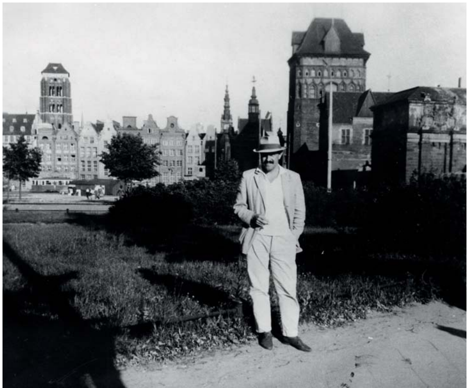
Günter Grass in Danzig um 1960

wissermaßen über den Menschen. Die Ausstellung beleuchtet anschaulich das Verhältnis Grass's zu Polen. Die Ausstellung ist naturgemäß sehr politisch: die Oder-Neiße-Grenze, der Warschauer Vertrag, der Kniefall, die Gewerkschaft Solidarnosc, die Streiks auf der Lenin-Werft, die Wende. Und immer ist Günter Grass irgendwie dabei. Die sehenswerte Ausstellung ist noch bis zum 30. Januar im Günter Grass-Haus zu sehen. Danach geht sie nach Gdansk. Sie geht also rück-