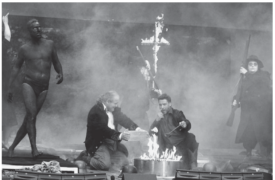
Der Freischütz, inszeniert von Kay Kuntze

Musikalisch konnte man sich erfreuen, wenn auch bei Chorszenen wegen der Bühnenkonstruktion der Zusammenhalt