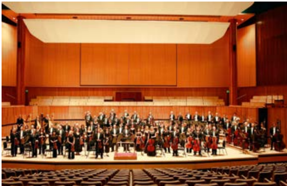
London philharmonic orchestra