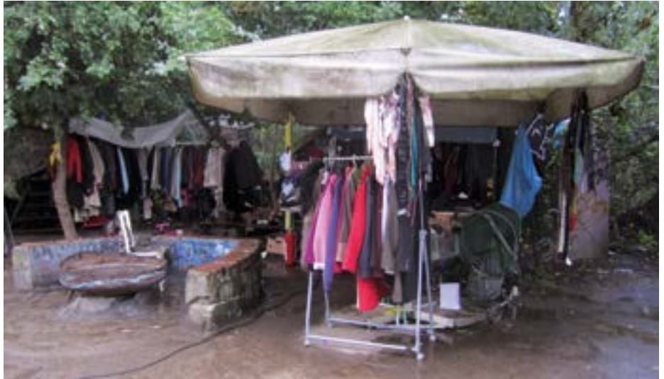
Kleiderstände für gespendete Frauenkleidung um die sommerliche Sitzgruppe am Feuerbecken

Inzwischen ist alles organisiert. Jede ankommende Gruppe wird in ihrer