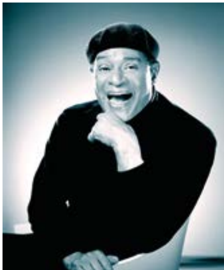
Al Jarreau

Wieder fundierte einleitend ein hochkarätiges musikwissenschaftliches Symposium den Komponistenschwerpunkt. Um „Grenzenlos? Tschaikowsky in Deutschland“ ging es am 11. Juli im Behnhaus, um problematische Rezeption und Pauschalurteile (darunter: „europäisierter Salonrusse“; „Musik, die man stinken hört“ [Hanslick]). Deutschland hat der Komponist oft besucht, darunter 1888 Lübeck für eine knappe Woche („... eine sehr nette Stadt“), wo er sich inkognito auf ein Hamburger Gastspiel vorbereitete. Brahms schätzte er als Person,