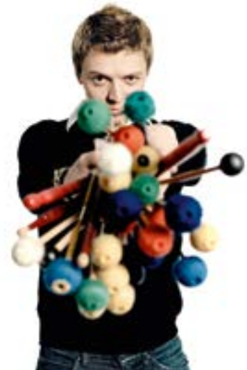
Martin Grubinger