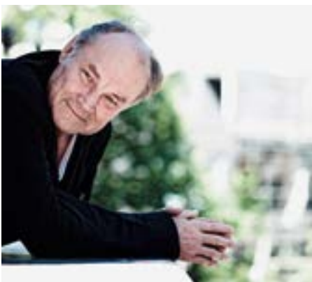
Klaus Maria Brandauer