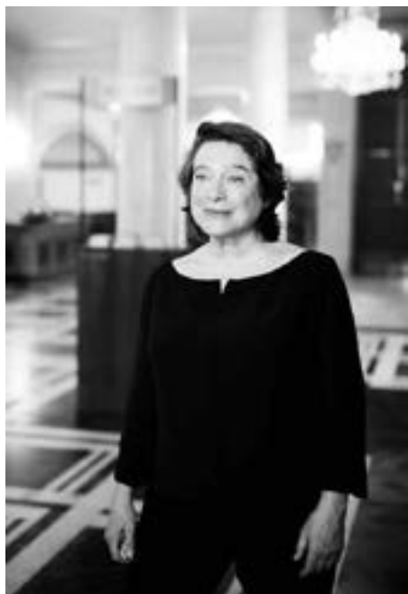
Patricia Kopatchinskaja

Manchmal ist die Nachspeise das Beste. Patricia Kopatchinskaja und Sol Gabetta zauberten am 19. August Kodálys Duo op. 7 für Violine und Violoncello mit gepfeffelter Rasanz und wunderba-