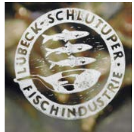
Stempel: Lübeck-Schlutup Fischindustrie. In: „Schlachtmalzeit“, 2014. Rainer Wiedemann

Schablonenformendruck (ein Wort, das nicht zu fassen scheint), kein Originaleindruck, der Druck des Druckes vom Text von Tucholsky bis Heine, (schön (wieder-) zu lesen), dazu Fotos, verschiedene Druckgraphiken hat sich Heinz