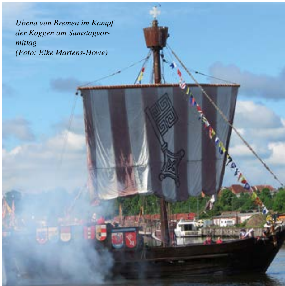
Ubena von Bremen im Kampf der Koggen am Samstagvormittag