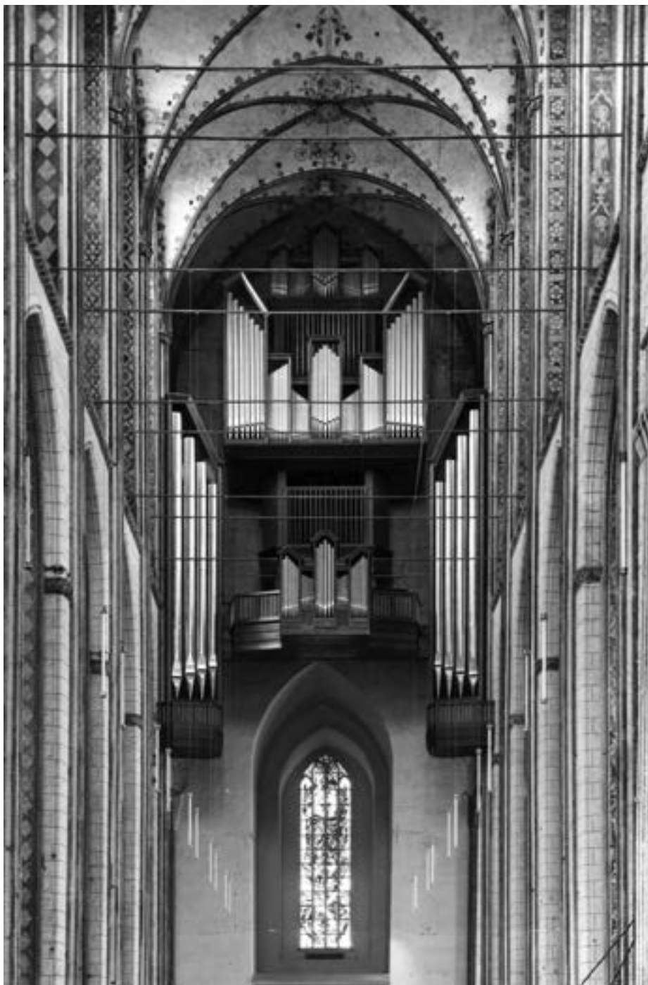
Marienkirche, Blick nach Westen auf die Kemperorgel

Orgelgutachten haben ergeben, dass sich alle drei Orgeln der St. Marienkirche in unterschiedlicher Weise in schlechtem Zustand befinden und nun Überlegungen angestellt werden müssen, inwieweit eine Restaurierung lohnt oder die Instrumente durch Neubauten ersetzt werden sollten. Die Große Marienorgel, 1962 bis 1968 von der Lübecker Orgelbaufirma Kemper erbaut, hat viele Mängel, die sich insbesondere aus der Verwendung schlechter Baumaterialien und konzeptioneller Schwächen erklären. Dies führte zuletzt dazu, dass einige der großen Pfeifen zusammensackten drohten. Die Totentanzorgel der Firma Führer aus dem Jahre 1986 ist Innen schon zum zweiten Mal von Schimmel befallen. Dies liegt u. a. auch an der sehr engen Bauweise der Pfeifenanlage. Auch die kleine Barockorgel in der Briefkapelle sollte restauriert werden, da viele der enthaltenen Materi-