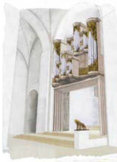
Modellzeichnung der neuen Schnitger Orgel: Architekturbüro Riemann

Architekt Hanno Nachtsheim erläuterte den Entwurf des Büros, erinnerte an die komplexe Aufgabenstellung, die schon in der Überschrift des Wettbewerbs zum Ausdruck komme: „Neugestaltung des westlichen Raumabschnitts unter Einbeziehung einer neuen Orgel im Dom zu Lübeck“. An der Werkaufteilung Arp Schnitgers habe man beim jetzt vorliegenden Entwurf nichts geändert. Die