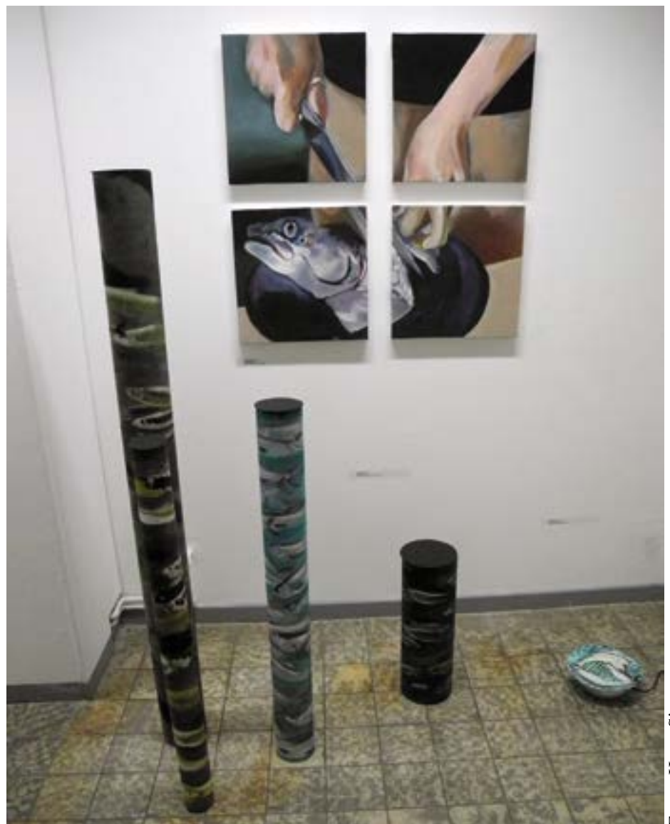
Barbara Engel „Schnitt“, „Wish you were here“, „Teleostei“, 2012-14

Die Ausstellung läuft bis zum 31. August 2014. Öffnungszeiten: Freitag 14.00 bis 17.00 Uhr, Samstag und Sonntag 10.00 bis 17.00 Uhr. Jeden Monat führen ein Künstler oder eine Künstlerin durch die Ausstellung: Nächste Führung: 15. Juni, 11.30 Uhr, mit Angela Siegmund. Adresse: Herrenwyk, Kokerstrasse 1-3. Tel. 0451/301152