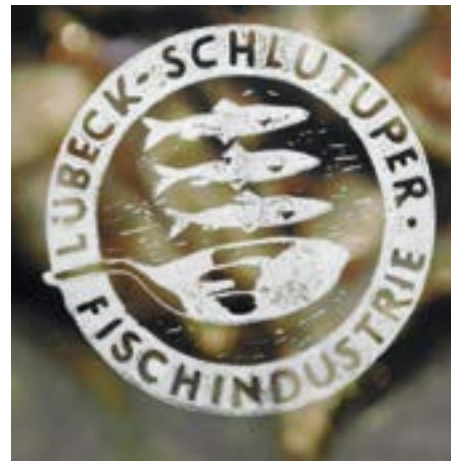
Stempel: Lübeck-Schlutup Fischindustrie. In: „Schlachtmalzeit“, 2014. Rainer Wiedemann

Schablonenformendruck (ein Wort, das nicht zu fassen scheint), kein Originaleindruck, der Druck des Druckes vom Text von Tucholsky bis Heine, (schön (wieder-) zu lesen), dazu Fotos, verschiedene Druckgraphiken hat sich Heinz