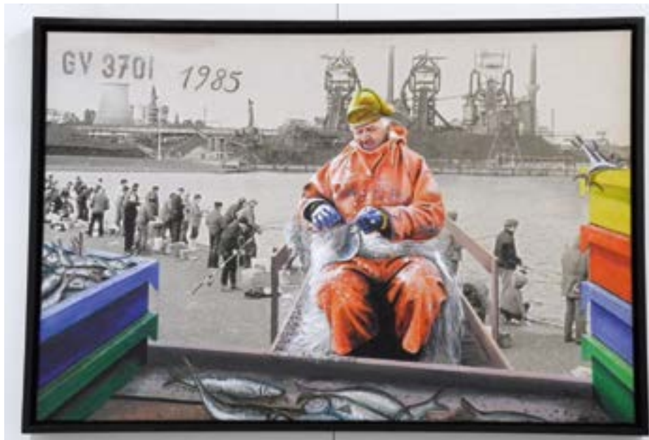
Rainer Wiedemann „GV 3701, 1985/2014, Fischer mit Anglern vor der Kulisse des Hochofenwerkes“, 2014, Pigmentdruck auf Leinwand

Ob Heringe-angeln an der Trave oder Lachsefischen im Jemen, der Fisch ist in der aktuellen Kunst als willkommenes Motiv, kulturtragendes Symbol und vielfach verwendbare Form wieder angekommen. Das Regionale berührt das Globale und mehr (auch Meer) vermischt sich. So „spricht der Fluss silbern“, wenn die Heringe zwischen Herrenwyk und der Schlutuper Wiek in der natürlichen Enge der Trave sich drängen und stauen. „Der Hering ist zurück!“ heißt es dann und das Angeln wird und wurde Freizeitspaß und auch ernste fischverarbeitende Industrie. Herrenwyk heißt auch schlicht Heringsbucht. Fisch in der Kunst ist ein unendliches Thema vom Christus-Symbol bis EU-Positiv. Acht Lübecker Künstlerinnen und Künstler haben sich diesem Kunst-Wesen „Fisch“ gewidmet. Sie lassen den Hering nicht nur silbern sprechen.