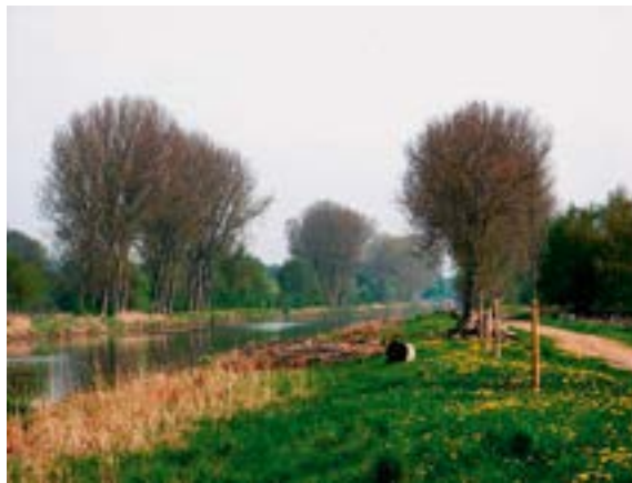
Der Elbe-Lübeck-Kanal

Der Umbau der Altstadt ist eines der großen Themen der Zeit. Wenn man schon im großen Stile alte, als veraltet eingestufte Bauten abreißt wie etwa große Teile des Burgklosters, wie muss dann neugebaut werden,