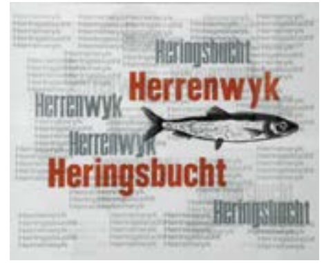
Heinz Vogler „Herrenwyk-Heringsbucht“, 2014, Monotypie: Linoldruck und Buchdruck

Was zeichnet diese sehenswerte Ausstellung aus? Einen neuen Schein auf die Realität jedes zweiten Herings, der – wohlbekannt – aus Schlutup kam. Das Thema wird aus dem Alltag gehoben und bekommt Frischwasser wie das Aufperlen von Sauerstoff im Kunstaquarium.