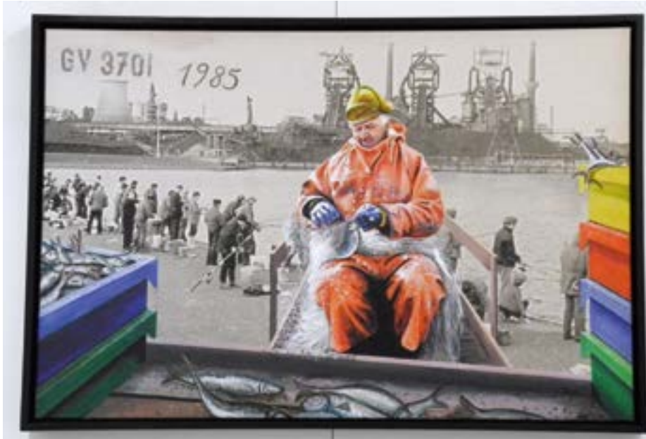
Rainer Wiedemann „GV 3701, 1985/2014, Fischer mit Anglern vor der Kulisse des Hochofenwerkes“, 2014, Pigmentdruck auf Leinwand

Ob Heringe-angeln an der Trave oder Lachsefischen im Jemen, der Fisch ist in der aktuellen Kunst als willkommenes Motiv, kulturtragendes Symbol und vielfach verwendbare Form wieder angekommen. Das Regionale berührt das Globale und mehr (auch Meer) vermischt sich. So „spricht der Fluss silbern“, wenn die Heringe zwischen Herrenwyk und der Schlutuper Wiek in der natürlichen Enge der Trave sich drängen und stauen. „Der Hering ist zurück!“ heißt es dann und das Angeln wird und wurde Freizeitspaß und auch ernste fischverarbeitende Industrie. Herrenwyk heißt auch schlicht Heringsbucht. Fisch in der Kunst ist ein unendliches Thema vom Christus-Symbol bis EU-Positiv. Acht Lübecker Künstlerinnen und Künstler haben sich diesem Kunst-Wesen „Fisch“ gewidmet. Sie lassen den Hering nicht nur silbern sprechen.