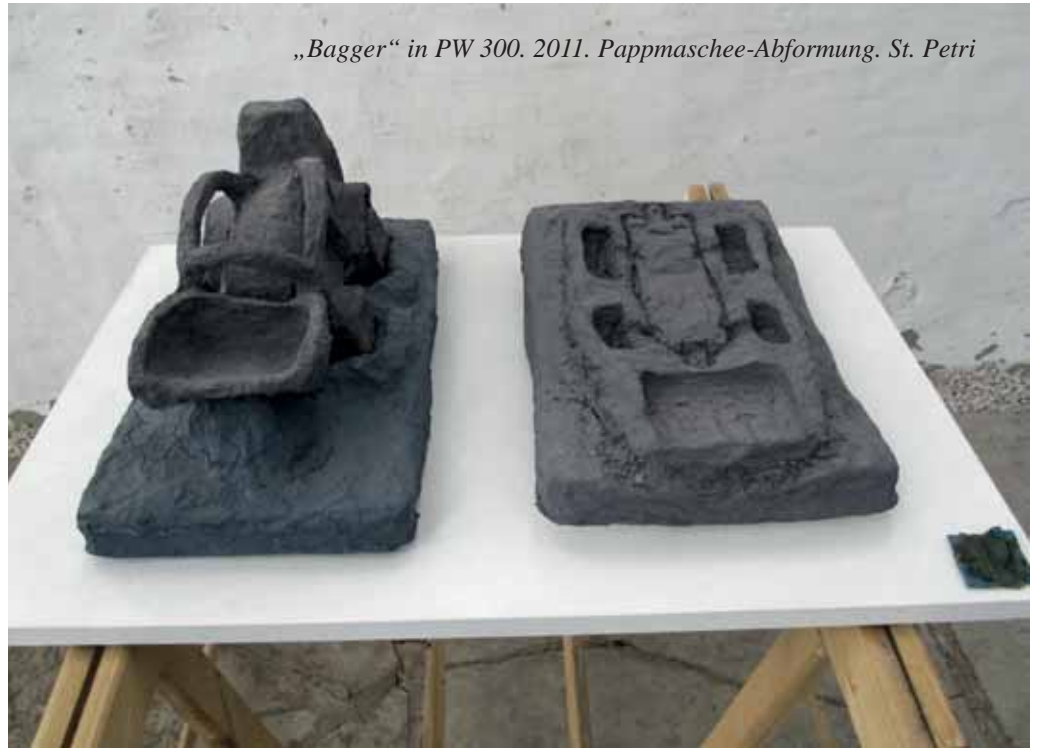
„Bagger“ in PW 300. 2011. Pappmaschee-Abformung. St. Petri