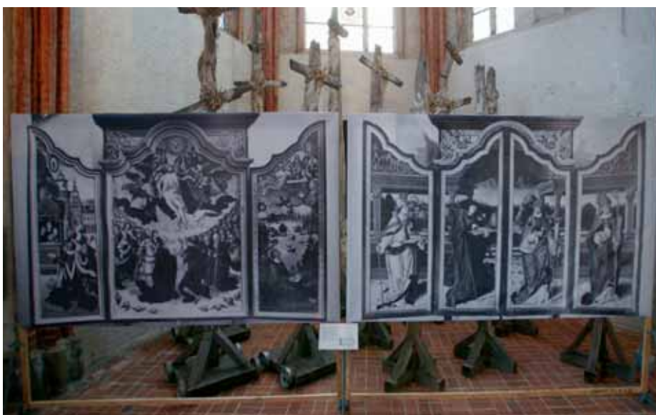
Der Dreifaltigkeitsaltar des Jacob von Utrecht, Innen- und Doppel-Klappflügel als fast 3 Meter hohe Schwarzweiß-Großfotos im südlichen Chorungang

Das Vorgehen erscheint bezeichnend für eine Generation, die in den 1950er-Jahren ihre Zeitgenossenschaft zu den NS-Jahren mit großer Tatkraft durch „Saubermachen“ verdrängte und sich zur Begründung auf eine ihnen von der Geschichte auferlegte „Bescheidenheit“ berief, durch die man unterschwellig wohl auch eine persönliche Läuterung erfahren haben mag. Dabei wurde der Fredenhagenaltar erwiesenermaßen schlicht Opfer einer rein geschmacklichen Entscheidung, die man mit einer heute allzu selbstgerecht erscheinenden protestantischen Ethik zu verbrämen verstand. Denn schon der hochfahrend-herrische Innenraum der gotischen Marienkirche dürfte wohl kaum dem 1958 „von uns geforderten Bekenntnis“ entsprochen haben ... Mit rigider Härte trennte man sich auch vom alten Kirchenfußboden: Bereits 1953 wich die geschichtsträchtige Pflasterung mit einst fast 200 steinernen Grabplatten einem „schlichten“ Ziegelfußboden. Die vielfach durch Brandfolgen geschädigten und geborstenen Platten konterkarierten die einen unbelasteten Neu-Beginn signalisierende Sauberkeit des Raumes, zumal, so die drei Jahre später nachgelieferte Begründung, zum „evangelischen Gottes-