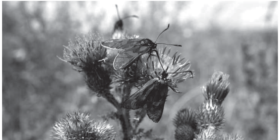
Das Sechsfleck-Widderchen oder auch Blutströpfchen ( Zygaena filipendulae ), eine Nachtfalter-Art, wurde auf dem Gelände der Metallhütte aufgenommen

Das gedruckte Programm für die diesjährigen Aktionstage „Artenvielfalt erleben“ steht ab sofort allen Interessierten zur Verfügung. Es ist mit ausführlichen Angaben zum Treffpunkt an zahlreichen öffentlichen Plätzen erhältlich – z. B. beim Lübecker Jugendring, in der Stadtbibliothek, in den Stadtteilbüros, beim Museum für Natur und Umwelt, beim Tourist-Service am Holstentor und in den Landwege-Geschäften. Im Internet kann