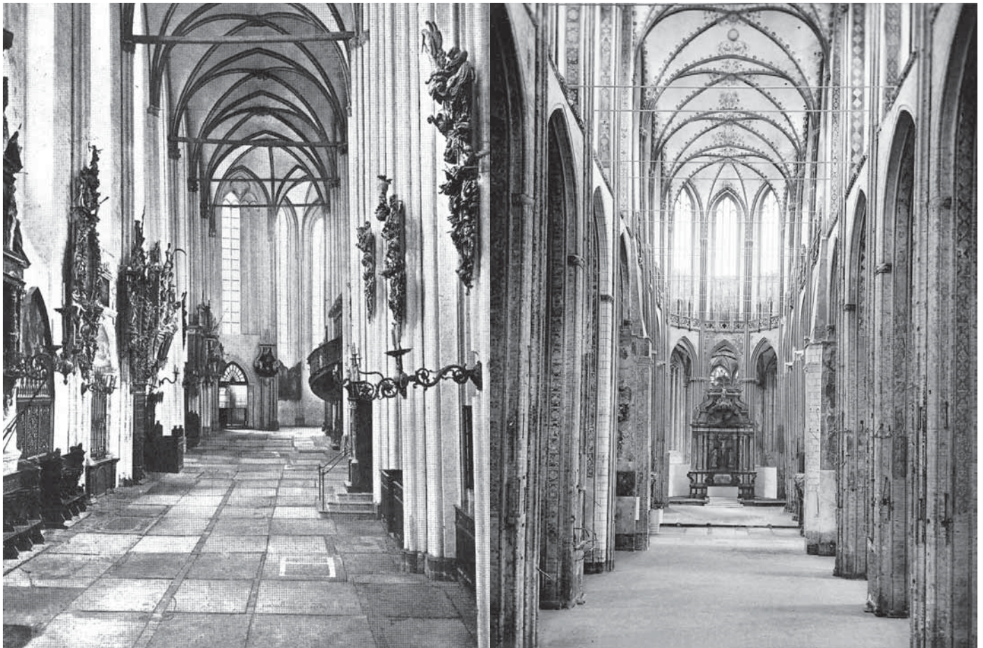
Das Nordschiff der Marienkirche um 1900. Der Kirchenboden besteht aus Grabplatten. Alle hölzernen Ausstattungsstücke – Epitaphien, Gestühle, Altäre – verbrannten 1942.