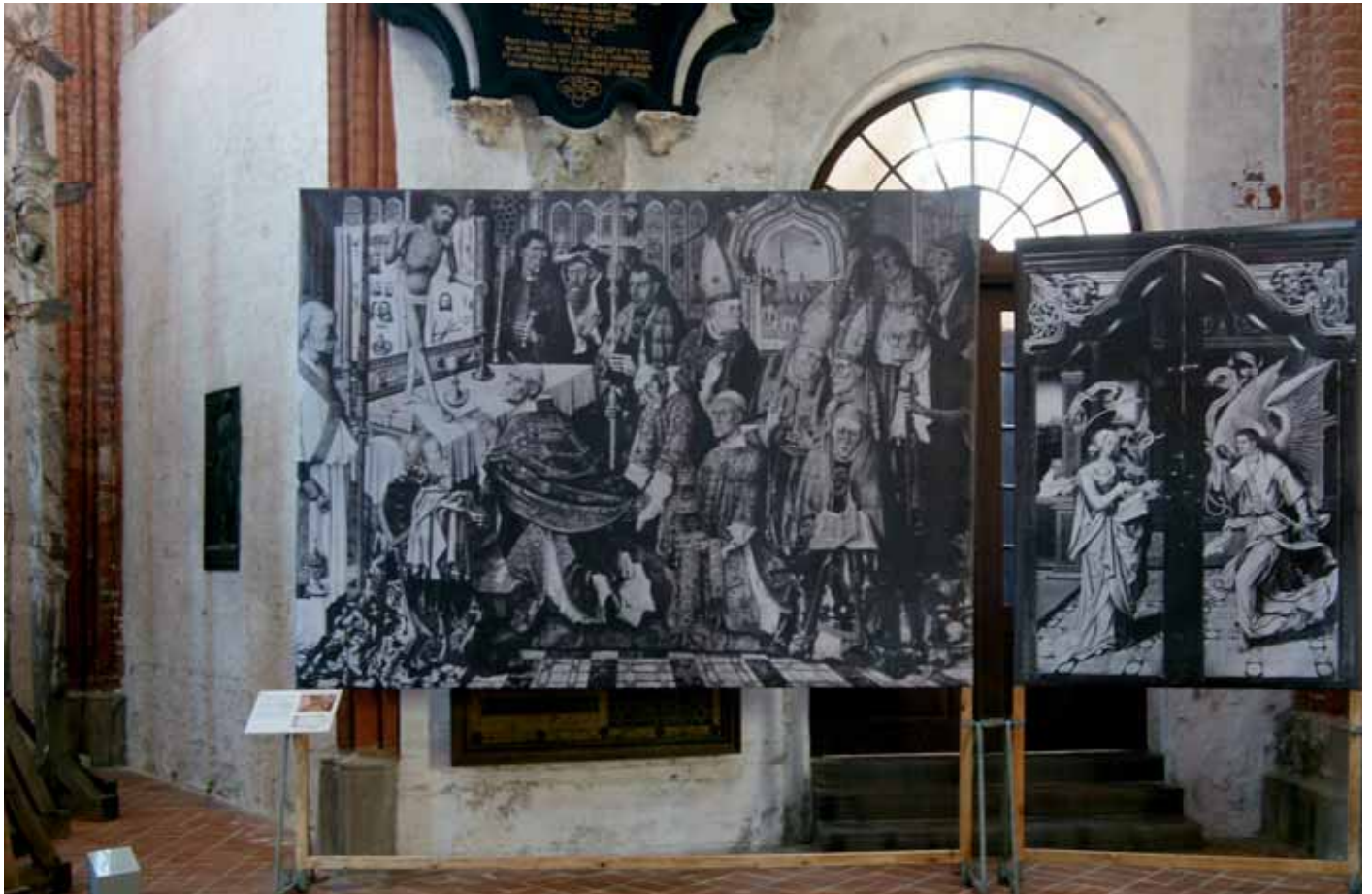
Bernt Notkes monumentale Gregorsmesse, bis 1942 in der südöstlichen Chorungangskapelle. Daneben die Außenansicht des Dreifaltigkeitsaltars von Jacob von Utrecht mit der schwungvollen Verkündigung.

che unserer Zeit schuldig ist“ 6 . Gradlinig dachte der Architekt die Gedanken seiner Auftraggeber weiter: Die „vollkommene Leerheit“ des Raumes sei „in der Kargheit seiner stilistischen Haltung so überaus klar und dem Empfinden unserer Zeit so ... verwandt, daß diese Leerheit in einem geradezu ergreifenden Gegensatz steht zu seinem früheren erdrückenden Reichtum