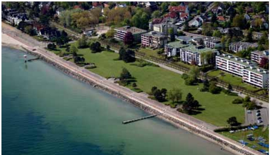
Der „Grünstrand“ in Travemünde, Luftaufnahme aus dem Sommer 2008

Bevor in der Bürgerschaftssitzung vom Januar eine Kontroverse über diese zusätzliche Einnahmequelle einer Übernachtungssteuer („Bettensteuer“) ausgetragen wurde, beschäftigte sich das Stadtparlament mit dem Dauerbrenner „Grünstrand“ in Travemünde. Die Grünen meldeten noch Beratungsbedarf (Stirnrunzeln bei der SPD; süffisantes Lächeln bei der CDU und der FDP) an und baten um eine (abermalige) Verschiebung der Diskussion. Der Antrag wurde abgelehnt. Dieser ließ weniger auf ein sachliches Informationsdefizit bei den Grünen als vielmehr auf die Uneinigkeit der Fraktion in dieser Angelegenheit schließen. Dazu unten mehr.