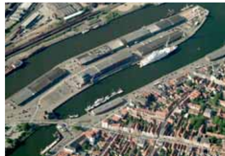
Nördliche Wallhalbinsel mit der Motor-yacht von Abramowitsch

Als Fazit ist festzustellen, dass ein Handlungskonzept für die Innenstadt für jetzige und zukünftige Anpassungsprozesse und Herausforderungen nicht vorliegt. Dieser Mangel trifft auch den von der deutschen UNESCO-Kommission im „Leitfa-