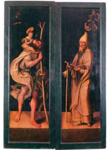
Gavnsø-Retabel, geschlossener Zustand mit den weitgehend monochromen Gemälden der Heiligen Christophorus und Antonius

Hermann Plönnies hatte nach Ida Greverades frühem