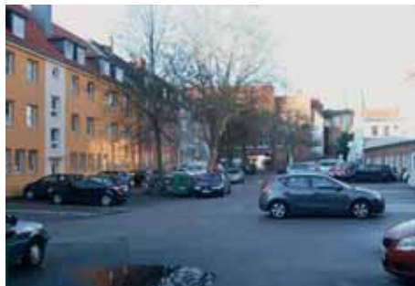
Versiegelter Blockinnenbereich für 50 Wohnungen, ohne Aufenthaltsqualität. Eigentümerin der Fläche: Hansestadt Lübeck, (Foto: Frank Müller-Horn)

Noch unter Bausenator Volker Zahn (von 1996-2003) gab es Überlegungen, die nördliche Wallhalbinsel als einen Zwischenschritt für den „Sprung über die Trave“ zu nutzen. Von der Roddenkoppel bis zur Teerhofinsel sollte ein Stadterweiterungsgebiet entstehen. Dabei sollte die nördliche Wallhalbinsel durch Nutzungsformen eine verbindende Komponente zwischen Altstadt und Neustadt darstellen.