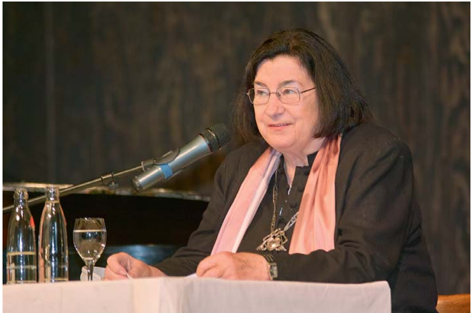
Christa Wolf am 23. Oktober in der Musikhochschule bei der Lesung aus „Stadt der Engel“

Im folgenden Abschnitt kam sie zu einem zentralen Thema ihrer Lebenspro-