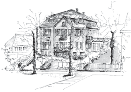
Familienbildungsstätte Lübecker Mütter- schule in der Jürgen Wullenwever Straße

lie“ erfreut sich mit seinen Kursen und Wochenendveranstaltungen nach wie vor großer Beliebtheit. Neu in diesem Fachbereich sind verschiedene Kurse über die Sprachentwicklung bei Kleinstkindern, die von einer Logopädin durchgeführt werden. Die Angebote für Eltern und Kinder sind breit gefächert und vielseitig. Insgesamt fanden in diesem Fachbereich 181 Kurse statt mit 1.882 Müttern, 194 Vätern und 2.076 Kindern. Die Nähkurse sind immer gut besucht. Auf großes Interesse stießen die Kurse „Stoffe färben“ und „Siebdruck auf Stoff“.